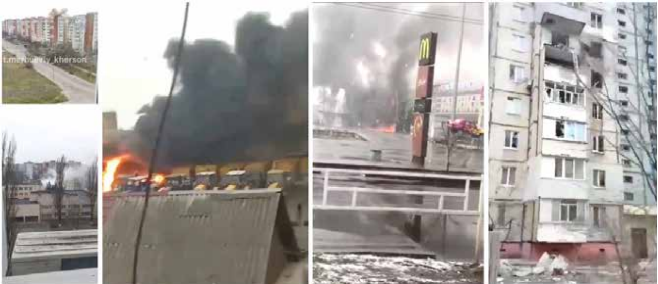
Руйнування цивільної інфраструктури Херсона в перші дні російського вторгнення, 24–28 лютого 2022 р. Фото та фрагменти відео з місцевих телеграм-каналів

моторошним повсякденням. Люди, доведені до відчаю, виявили свою здатність до відчайдушних вчинків, відкривали у собі нові сили для опору та нові шляхи для його реалізації.