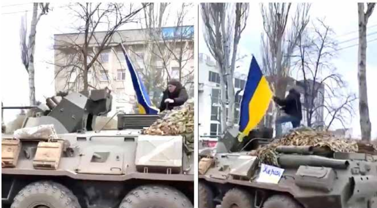
Мітингар з українським прапором заплигує на російський бронетранспортер, що рухається проспектом Ушакова (тепер – проспектом Незалежності)