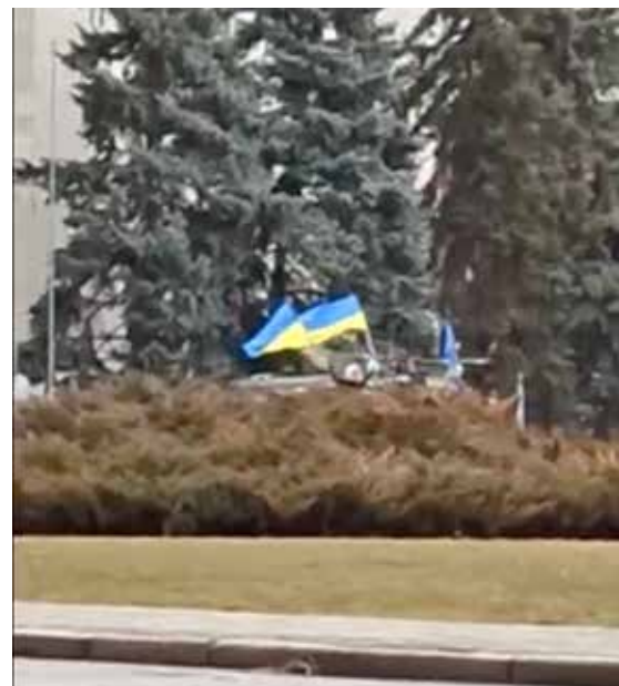
Мітингар забирає назад українські прапори в російських військових. Херсон, площа Свободи. 2 березня 2022 р. Фрагмент відео з херсонських телеграм-каналів