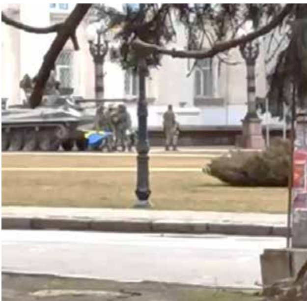
Російський військовий забрав український прапор в учасників мітингу в Херсоні. 2 березня 2022 р. Фрагмент відео з херсонських телеграм-каналів

2 березня – перший мітинг. Люди поодинокі і невеликими групами приходили до російських військових, що зайняли позиції біля ОДА, намагались пояснити, що росіяни коять злочин на території України.